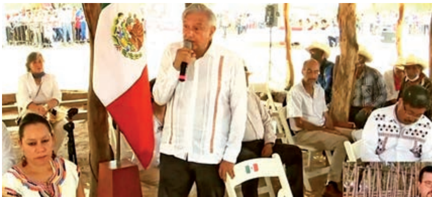
El Presidente tuvo una reunión con autoridades yaquis.