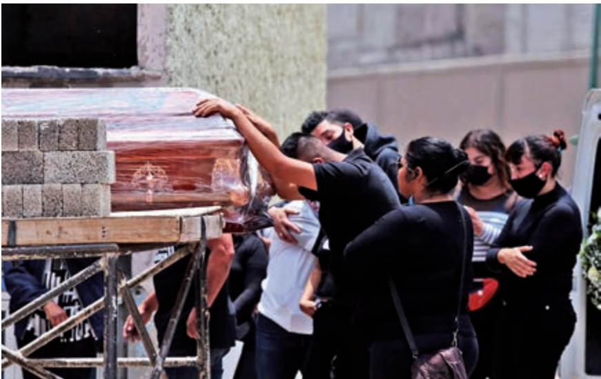
La SSA reportó 819 nuevas muertes por Covid-19, con lo que suman 50,517.

xico contabilizaba 118 contagios, aún no iniciaba la Jornada Nacional de Sana Distancia ni tampoco se habían suspendido los eventos masivos.