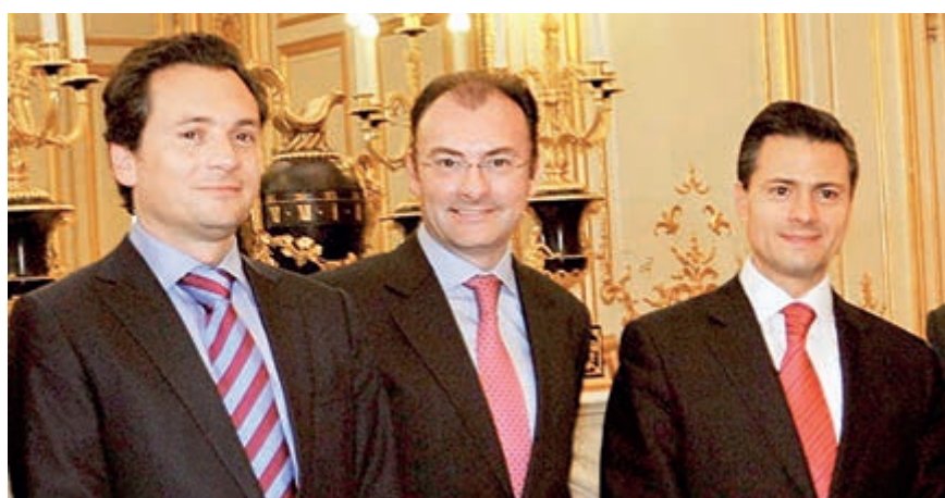
El ex-director de Pemex lanzó grave acusación contra Videgaray y Peña.

En el foro realizado por videoconferencia, el titular de la FGR reiteró que todos los involucrados están siendo investigados por el organismo.