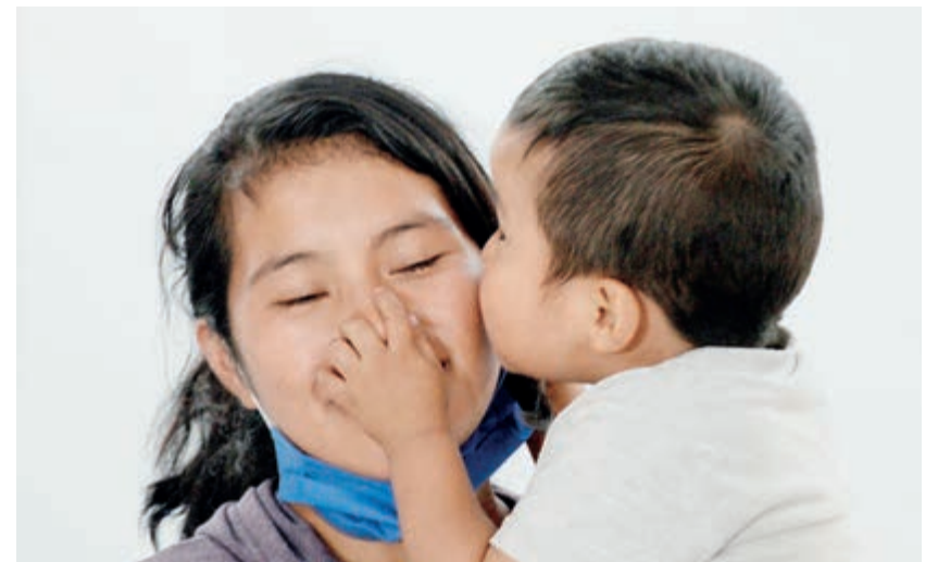
Terminó la pesadilla de la joven madre y su hijo: ayer se reencontraron.